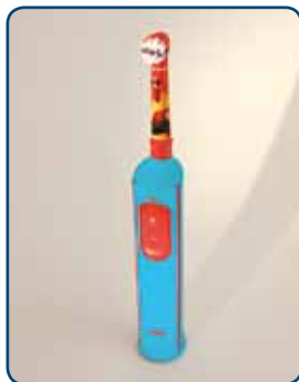
Elektrische tandenborstels voor kinderen hebben een speciale kleine borstelkop

Gebruik een tandenborstel met een kleine borstelkop met zachte haren. Zo komt u overal makkelijk bij. Zodra kinderen een tandenborstel kunnen vasthouden, kunnen ze ook elektrisch poetsen. Er zijn speciale elektrische tandenborstels en opzetborstels voor kinderen. Die zijn kleiner en daarom geschikt voor de kindermond. Poetsen met een elektrische tandenborstel is juist leuk voor kinderen. Het draagt bij aan de motivatie om het gebit goed te verzorgen. Kies een tandpasta met fluoride. Fluoride zorgt voor de versterking van het glazuur. Voor