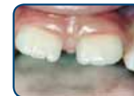
Tanden van het blijvend gebit hebben een kartelrand