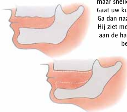
Het slinken van uw kaken gaat heel ongemerkt

Gaat uw kunstgebit loszitten? Ga dan naar uw behandelaar. Hij ziet meestal direct wat er aan de hand is en kan u het beste advies geven.