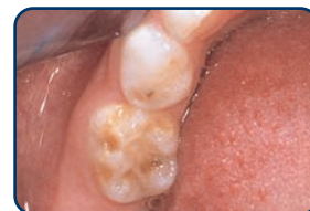
Een kaaskies in een melkgebit

Kaaskiezen zijn kiezen met plekken waarvan het glazuur minder hard is. Deze plekken zijn herkenbaar aan de geelbruine verkleuringen. Meestal treden ze op bij de eerste grote kiezen (zie foto's). De afwijking kan zich beperken tot enkele plekkjes, maar ook kan een heel vlak worden aangetast. In kaaskiezen ontstaan vaak gaatjes. Ook kunnen ze snel afbrokkelen door slijtage. Ze zijn vaak gevoelig voor koud en warm en ook zoetigheid doet vaak zeer. Kinderen met kaaskiezen vermijden daarom wel vaker zoetigheden. Denkt u dat uw kind last heeft van kaaskiezen? Neem dan contact op met uw tandarts.