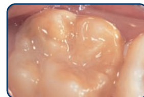
Een kaaskies in een blijvend gebit