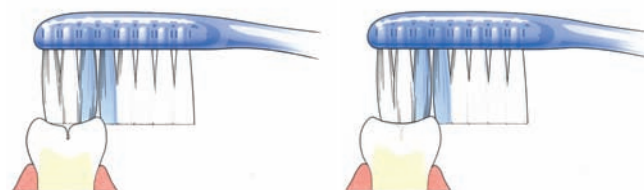
Tandenborstel komt niet in de groef

Bij zowel melkkiezen als blijvende kiezen zitten veel groefjes op het kauwvlak. Daarin ontstaat gemakkelijk tandplak. Niet regelmatig verwijderde plak kan gaatjes veroorzaken. Goed poetsen dus. Om het kauwvlak goed te beschermen, kan de tandarts een laagje 'kunsthars' (sealant) aanbrengen. Dit heet 'sealen'. Diepe groeven kan uw tandarts door het sealen afdichten. Alleen de blijvende kiezen komen normaal gesproken in aanmerking om te sealen. Dit gebeurt meestal kort nadat de blijvende kiezen helemaal zijn doorgebroken. De tandarts zal alleen sealen als hij verwacht dat er gaatjes in de groefjes ontstaan. Ook gesealde kiezen moeten goed worden gepoetst.