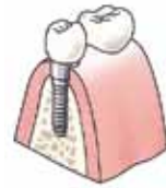
De kroon is op het implantaat geplaatst