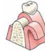
Het tandvlees wordt losgemaakt