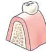
Plaats waar het implantaat komt

De tandarts of kaakchirurg brengt de implantaten in. Eerst krijgt u een plaatselijke verdoving. Daarna wordt het tandvlees op de plek waar het implantaat moet komen losgemaakt, zodat het kaakbot zichtbaar wordt. Dan wordt een gaatje in het kaakbot geboord. Daarin wordt het implantaat geschroefd of getikt. Het tandvlees wordt vervolgens gehecht. Als u meer dan één implantaat nodig heeft, worden deze vrijwel altijd tijdens dezelfde behandeling ingebracht.