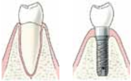
Een wortel met kies

Een implantaat kunt u het beste vergelijken met een kunstwortel. Een implantaat vervangt een afwezige tandwortel en wordt als een schroef in de kaak gebracht. Implantaten worden gemaakt van een lichaamsvriendelijk materiaal zoals titanium.