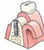
Het implantaat wordt aangebracht