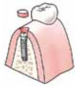
Een stukje tandvlees wordt weggenomen

Nadat een of meer implantaten in het kaakbot zijn verankerd, plaatst de tandarts hierop de kroon, brug of prothese. Hij neemt daarvoor onder plaatselijke verdoving soms eerst een klein stukje van het tandvlees boven het implantaat weg.