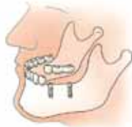
Drie kiezen zijn vervangen door twee implantaten voorzien van een brug

De implantaten worden in deze situatie van een vastzittende brug voorzien. Een brug is een voor de patiënt niet uitneembare vervanging van één of meer ontbrekende tanden en/of kiezen.