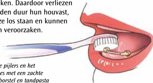
Poets de pijlers en het tandvlees met een zachte tandenborstel en tandpasta

Implantaten die als pijlers dienen onder een overkapingsprothese maakt u schoon met een zachte tandenborstel, ragers en/of (super)flossdraad. Poets tweemaal per dag het deel van het implantaat dat boven het tandvlees uitsteekt. Besteed extra aandacht aan de overgang van het implantaat naar het tandvlees. Reinig de ruimte onder de spalk met ragers en/of superfloss op aanwijzing van uw tandarts of mondhygiënist. Als u voedselresten en plak rond de implantaten niet weghaalt, gaat het tandvlees ontsteken. Daardoor verliezen ze op den duur hun houvast, gaan ze los staan en kunnen ze pijn veroorzaken.