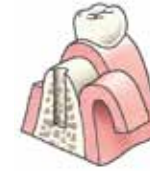
Er wordt een gaatje in het bot geboord