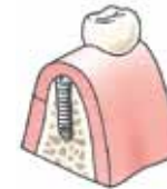
Het tandvlees wordt gehecht