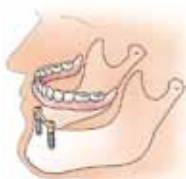
Twee met elkaar verbonden implantaten dienen als verankering voor de overkappingsprothese

Dan kan op implantaten (meestal twee) een overkappingsprothese worden geplaatst. Deze wordt op de implantaten vastgeklemt.