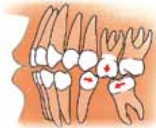
Zij aanzicht van een kaak: uitgroeien en scheef gaan staan van kiezen

Als tanden en kiezen ontbreken, kunnen de tanden of kiezen van de andere kaak in de richting van de open ruimte groeien. Ook kunnen de tanden of kiezen aan weerszijden van de open ruimte naar elkaar toe groeien, waardoor ze scheef gaan staan.