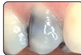
Grijze of zwarte vulling